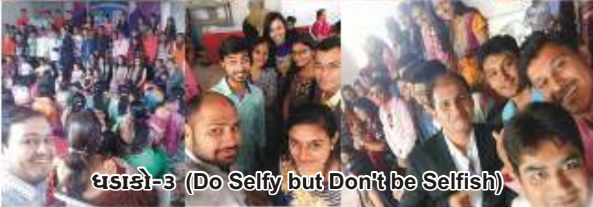
ઘડાકો-૩ (Do Selfy but Don't be Selfish)