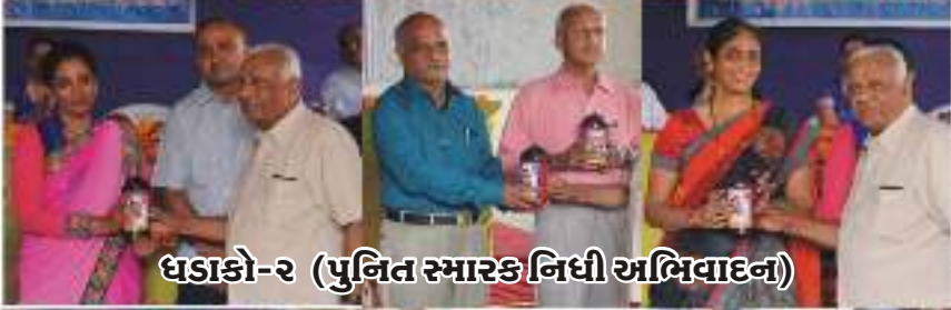
ઘડાકો-૨ (પુનિત સ્મારક નિધી અભિવાદન)