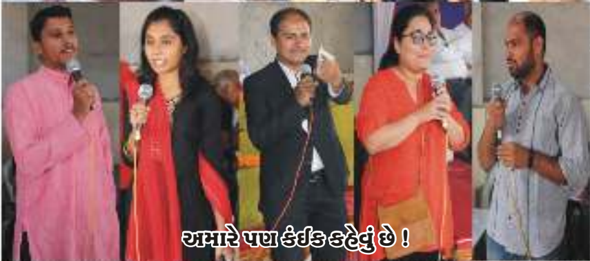
અમારે પણ કંઈક કહેવું છે !