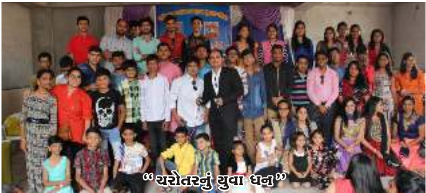
“ચરોતરનું યુવા ધન”

સમગ્ર કાર્યક્રમમાં કરમસદ પંચે કરેલ કામગીરી તથા કરમસદ યુવક મંડળની સહકારની નોંધ લેતા સૌ જ્ઞાતિજનોએ આનંદની લાગણી અનુભવી હતી કે હવે ચરોતરમાં વસો બાદ બીજી આપણા ઘર જેવી વાલમવાડી કરમસદમાં થઈ રહી છે. એટલું જ નહીં કરમસદ પંચ તરફથી વાલમ-ડે ૨૦૧૭ માટે પણ અગાઉથી આમંત્રણની જાહેરાત કરવામાં આવી. વાલમ-ડેની વ્યવસ્થા અને જમાણવાર (કાઠીયાવાડી ભોજન) ની સુંદર સગવડ માટે ચરોતર વા. બ્રા. યુવક મંડળ તરફથી વા. બ્રા. પંચ, કરમસદ તથા કરમસદ-આણંદ-વિદ્યાનગરના જ્ઞાતિજનો પ્રત્યે આભારની લાગણી વ્યક્ત કરે છે.