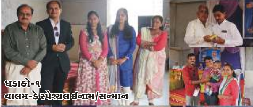
ઘડાકો-૧ વાલમ-ડે રૂપેશ્યલ ઈનામ/સન્માન